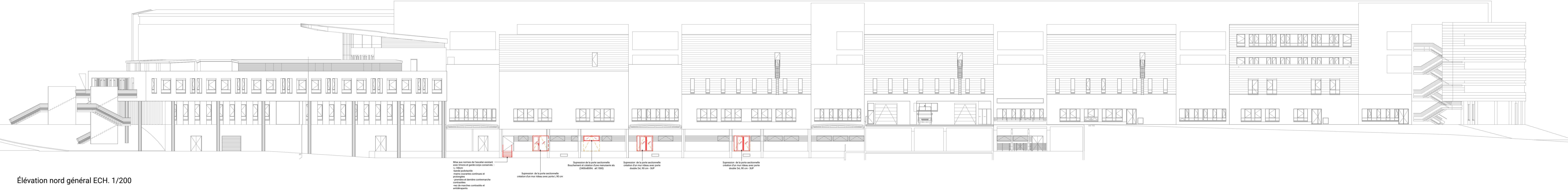
Élévation nord général ECH. 1/200